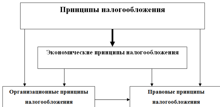
Рисунок 1. Классификация принципов налогообложения

Среди принципов налогообложения, и об этом указывалось выше, можно выделить не только экономические и организационные, но также и правовые. К ним можно отнести общие и специальные принципы налогового права.