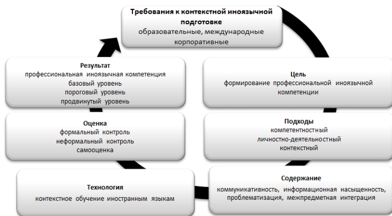
Рисунок 1. Модель контекстной иноязычной подготовки в системе профессионального образования

В заключение следует отметить несколько основных принципов моделирования процесса контекстной иноязычной подготовки в системе профессионального образования: во-первых, четкая ориентация на требования работодателя, что способствует приведению в соответствие результатов иноязычной подготовки студентов экономистов и потребностей рынка труда; во-вторых, акцент на организационные и содержательные аспекты контекстного обучения иностранным языкам, включающего 3 основные формы деятельности (учебная деятельность академического типа, квазипрофессиональная деятельность, учебно-профессиональная деятельность); и в-третьих, оценка сформированности профессиональной иноязычной компетенции, которая решает задачу включения неформального контроля и самооценки в процесс иноязычной подготовки в вузе. Построение образовательного процесса на основе обратной связи, как известно, определяет его качество.