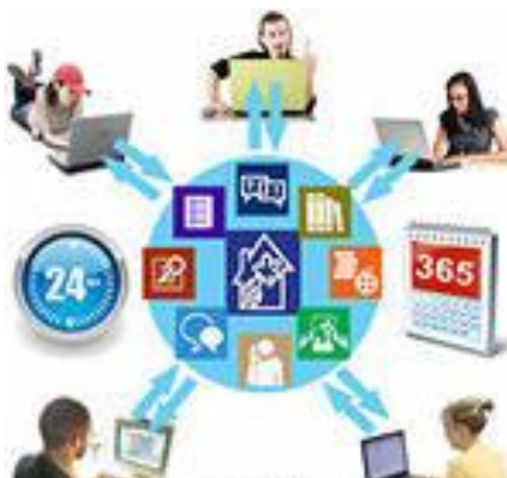
Рисунок 3. FIR-модель

За последнее десятилетие комбинированное обучение стало горячей темой обсуждений — это вызвано тем, что сила комбинирования онлайн обучения с практическими семинарами уже доказана. Например, многие крупные организации для развития своих сотрудников применяют серии обучающих занятий, построенных на такой модели. В соответствии с этой микро-моделью обучения предлагается вводить контент (материалы) и организовывать деятельность в более короткие отрезки времени. Такая модель называется «FIR-модель». Модель включает в себя фундаментальное обучение (F), погружение (I) и закрепляющее обучение (R), (рисунок 3).