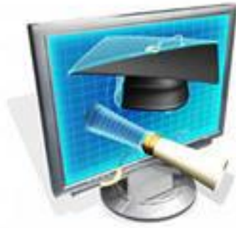
Рисунок 2. Переход от иллюстраций к видео

В-третьих, планирование комбинированного обучения