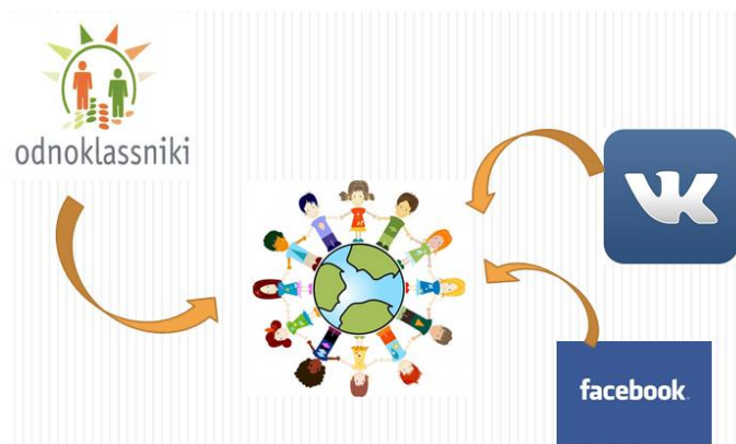
Рисунок 4. Содействие совместному обучению

В данной проекции совместное развитие учеников может проявляться в обучении посредством участия в дискуссиях, выполнения домашних заданий и размещения результатов в общем доступе («Файлы», «Медиатека») или участия в обучающих играх онлайн (Образовательные приложения, конкурсы). Совместное обучение может также принимать форму общения в неформальных группах («Группы», «Сети»), (см. рисунок 4).