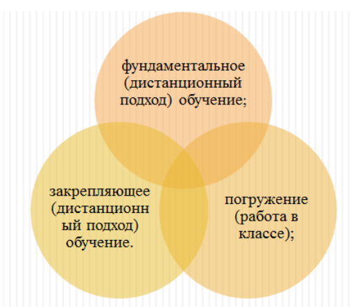
Рисунок 6. Комбинированный подход

Комбинированный подход, сочетающий обучение в классе и дистанционное обучение, позволяет углубить знания обучаемого через фундаментальное (дистанционный подход) обучение, погружение (работа в классе) и закрепляющее (дистанционный подход) обучение (рисунок 6). Моделируя ситуации, можно мотивировать обучающегося работать в команде и решать многочисленные сложные проблемы, тем самым позволив ему продемонстрировать полученные навыки и проявить личностные качества [4].