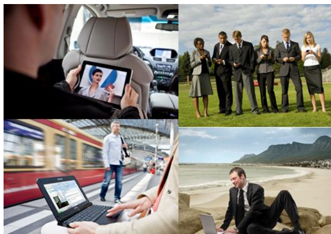
Рисунок 1. Мобильное использование мультимедии

Во-вторых, переход от иллюстраций к видео