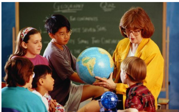
Рисунок 5. Пример коммуникации «учитель-ученик»

в классе для отработки умений и знаний, проведения обсуждений, прямой коммуникации «учитель-ученик» (рисунок 5) [1].