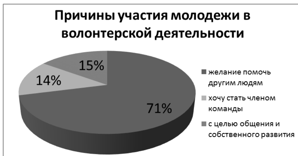
Рисунок 1. Причины участия молодежи в волонтерском движении

Молодежь служит основой волонтерского движения во всем мире. Мотивы молодых людей, вступивших в ряды волонтеров, различны, как показывают результаты исследования, наглядно представленные на рисунке 1.