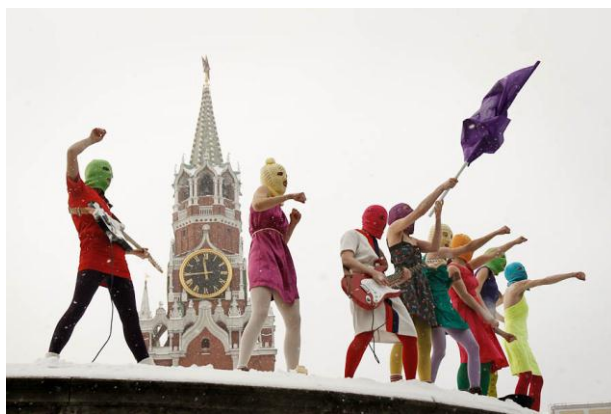
Рисунок 4. Выступление группы Pussy Riot на Лобном месте с песней «Путин зассал» 20 января 2012 года

В контексте исполненной песни Pussy Riot вспоминают события 1968 года, сидячую акцию протеста диссидентов на Красной площади, после которой они были подвергнуты пыткам и отправлены в психбольницы, тюрьмы и ссылки. Те же силовые структуры, что были при Брежнев, остались у власти, они никуда не ушли, считают девушки. Изменились формы авторитаризма, контроля и государственного террора.