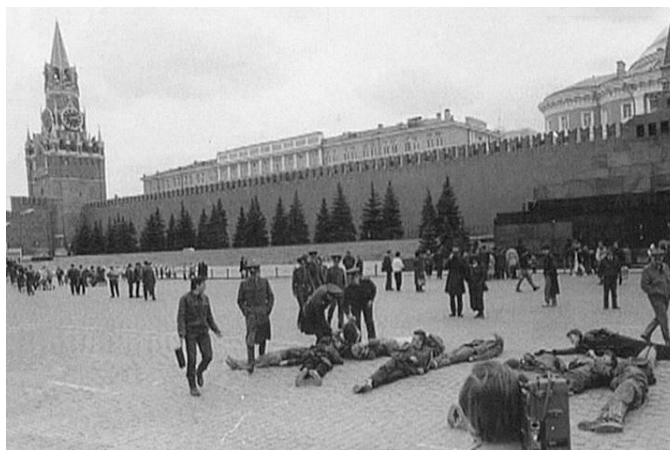
Рисунок 2. В 1991 году участники арт-группы «Э.Т.И.» во главе с Осмоловским выложили своими телами слово из трех букв на Красной площади

выложено нецензурное слово. Акция была приурочена к выходу так называемого «закона о нравственности», согласно которому в публичных местах запрещалось ругаться матом. Идея акции состояла в совмещении двух противоположных по статусу знаков: Красной Площади, как высшей иерархической географической точки на территории СССР, и самого запрещенного слова в лексиконе русского языка. Собственно, это и есть наиболее эффективный способ скандала: привнесение в высший, сакральный, официальный контекст нечто маргинальное, запрещенное и вытесненное. Что касается протестного смысла, то это был вызов против повышения цен и практически физической невозможности существовать и работать.