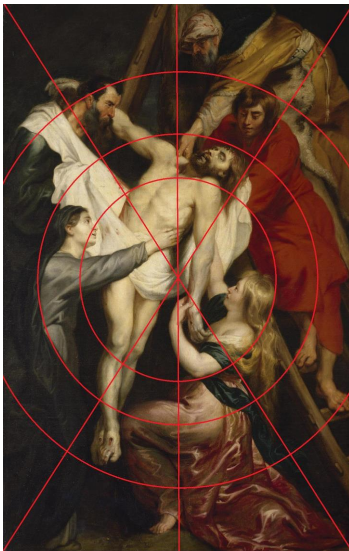
Рисунок 3. Питер Пауэл Рубенс. Снятие с креста. Ок.1617-1618. Холст, масло. 297 x 200 см. Государственный Эрмитаж, Санкт-Петербург. Радиально-кольцевая композиция и оптический центр