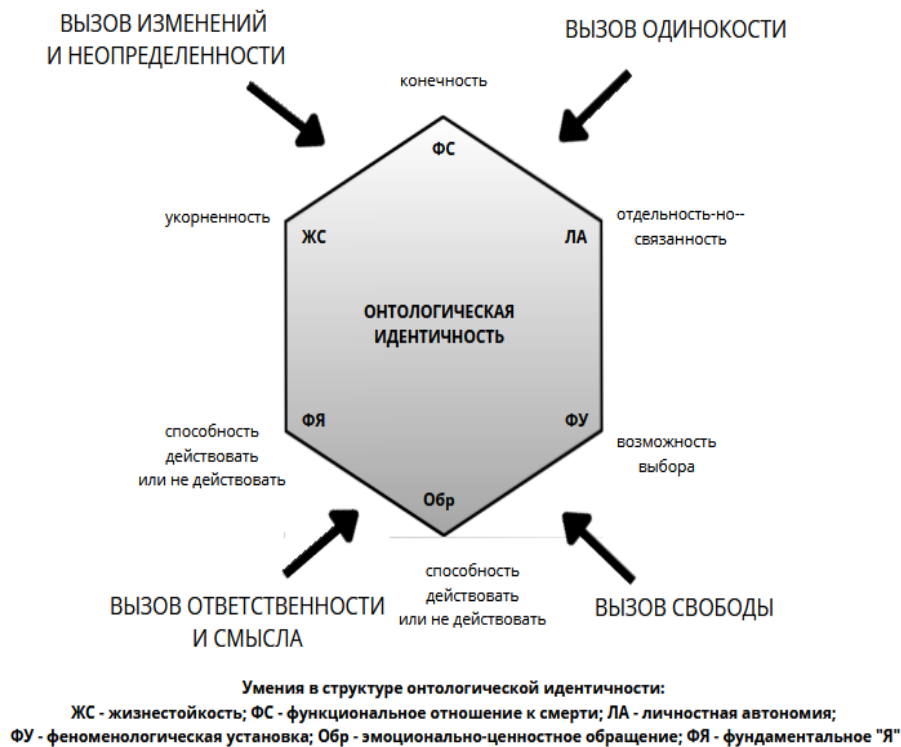
Рисунок 1. Рабочая модель структуры онтологической идентичности

На основании проведенного анализа предлагается рабочая модель онтологической идентичности человека – см. рис. 1.