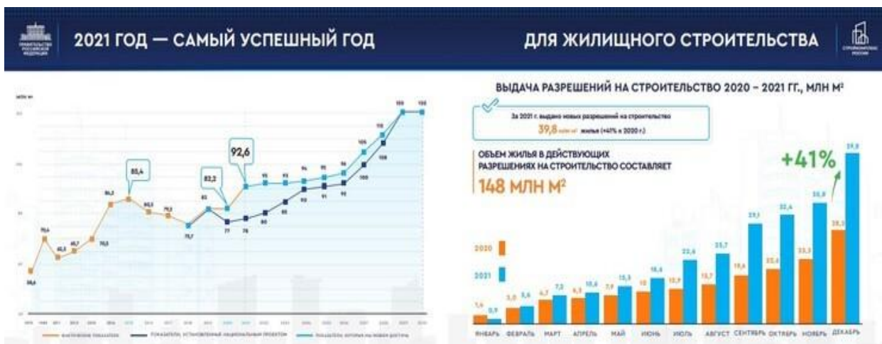
Рисунок 1. Динамика роста введенного жилья.

Однако резкий скачок спроса спровоцировал и рост средней стоимости квадратного метра жилья в новостройках – от 16 до 70%, за которой потянулись вверх и цены на вторичном рынке – от 12 до 89%, в зависимости от региона.